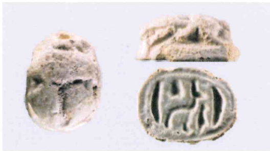
Fig. 11, 2:1