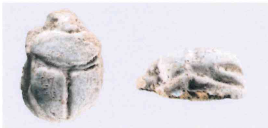
Fig. 13, 2:1