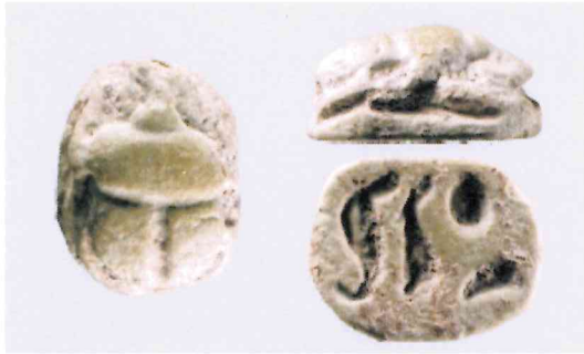
Fig. 9, 2:1