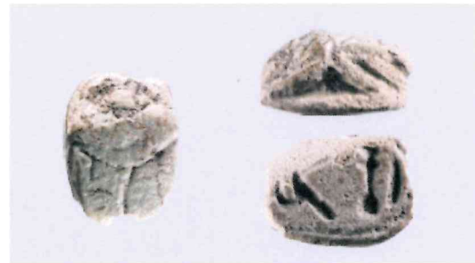
Fig. 12, 2:1