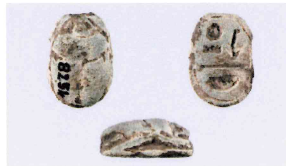
Fig. 8, 1:1

Figg. 1-2: Torre Galli; figg. 3-5: Canale; fig. 6: Occhio di Pellaro; figg. 7-8: Locri.