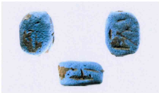
Fig. 5, 3:1