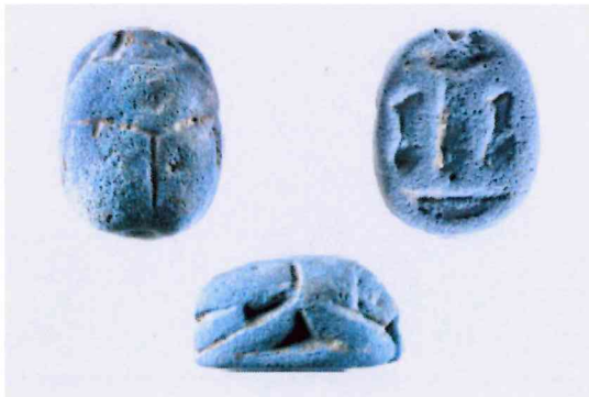
Fig. 3, 2:1