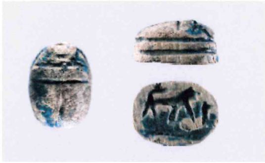
Fig. 1, 2:1