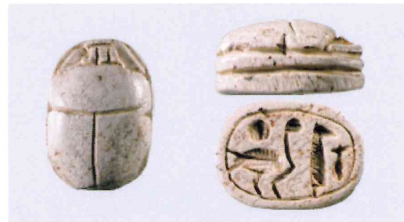
Fig. 6, 2:1