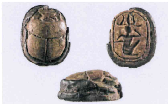
Fig. 7, 2:1