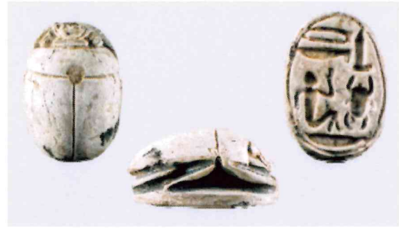
Fig. 2, 2:1