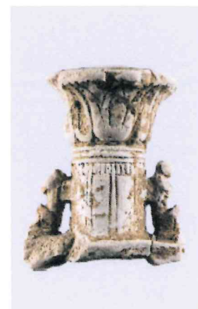
Fig. 16, 1:1

Figg. 9-14: S. Stefano di Grotteria; figg. 15-16: Locri, Mannella.