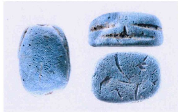
Fig. 4, 3:1