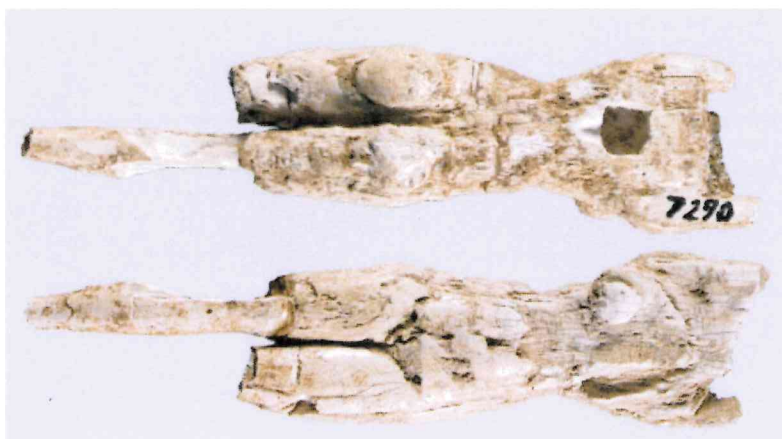
Fig. 15, 1:1