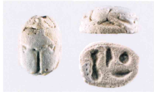
Fig. 10, 2:1